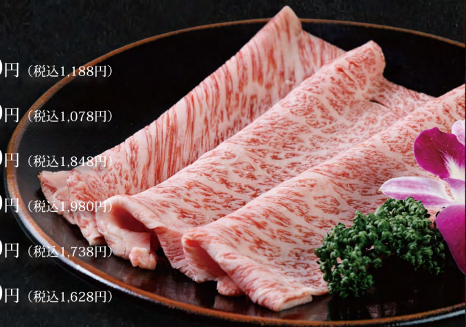
特選焼きしゃぶロース