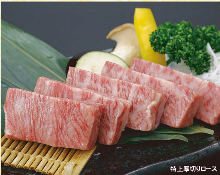
特上厚切りロース