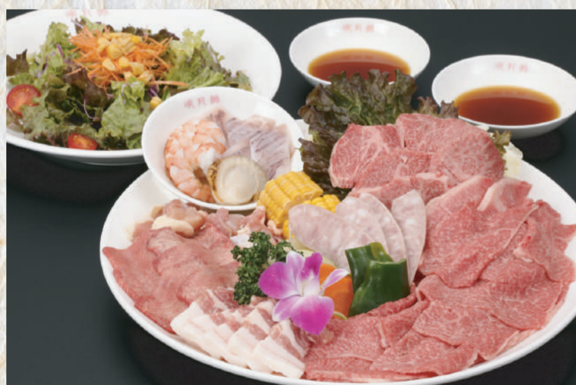
ファミリーセット