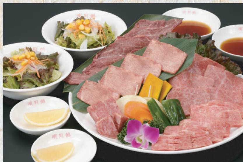
特選デラックスセット