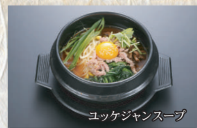
ユッケジャンスープ