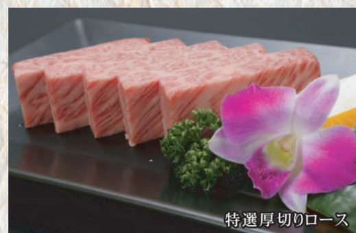
特選厚切りローズ